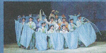
■《白蛇傳》之〈水漫金山〉來自廣東舞蹈戲劇職業學院學生飾演水族。