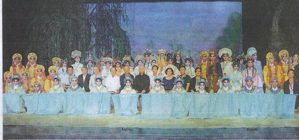
■粵港澳三地人員大合照。